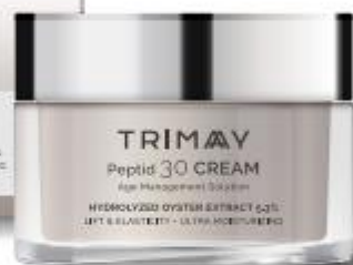
Peptide 30 Cream 50 ml