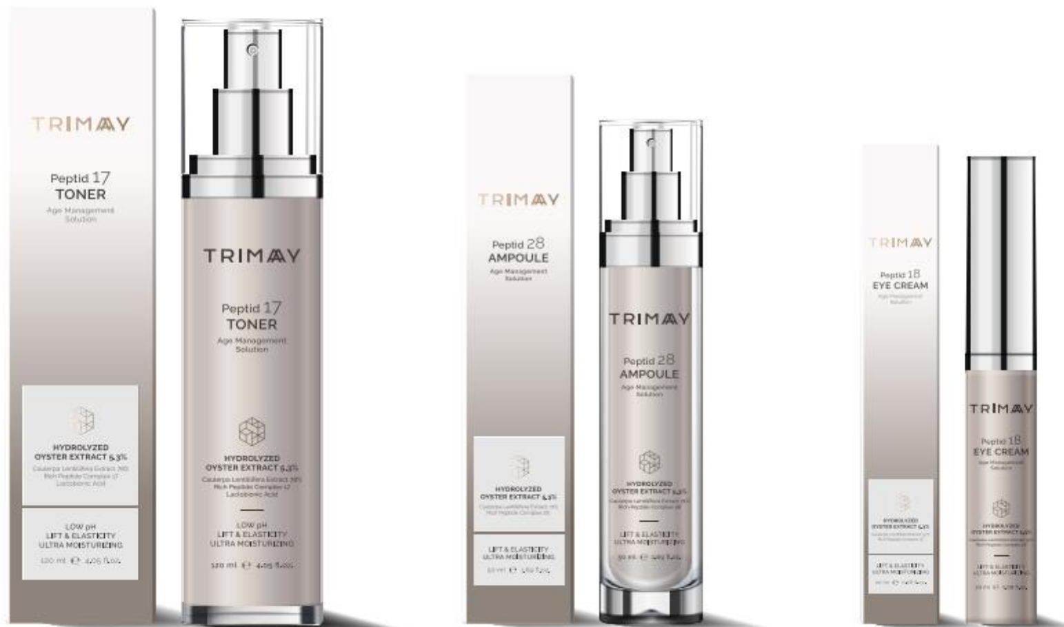
Peptide 17 Toner 120 ml