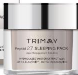
Peptide 27 Sleeping Pack 50 ml