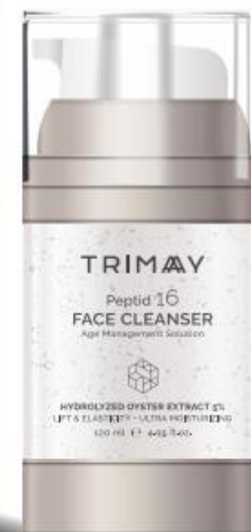
Peptide 16 Face Cleanser 120 ml